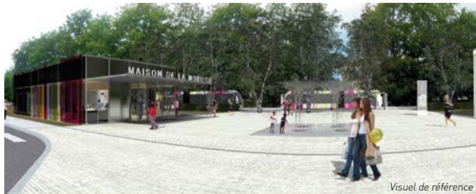
Visuel de référence

Le projet est pensé comme un espace pacifié où les modes de déplacement convergent et s'intègrent, avec une place privilégiée pour les piétons, les cyclistes et les transports en commun. Nous avons suivi une règle simple et essentielle : tout espace public agréable aux personnes à mobilité réduite est agréable à tous.